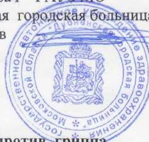
График вакцинации детей ДОУ №22 против гриппа.

14.09.2020 г.- старшие и подготовительные группы ДОУ,